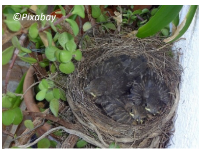
Nid de Merle noir