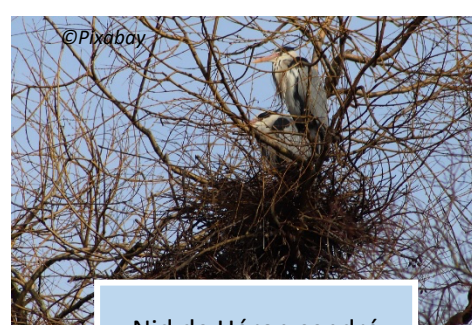
Nid de Héron cendré